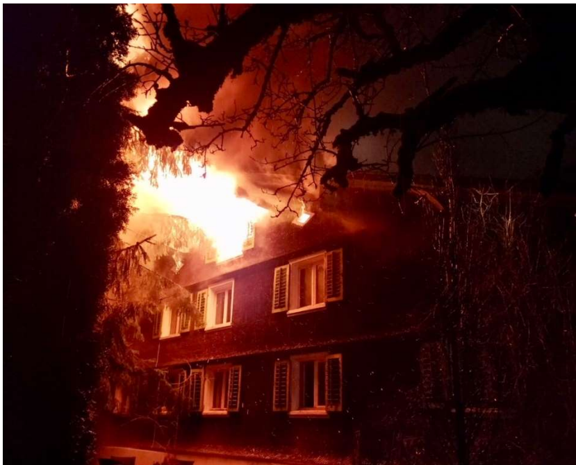
Beim Brand in Schwarzenberg am 13. März wurde ein Mehrfamilienhaus unbewohnbar