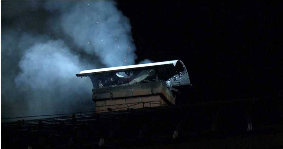
Sehr hohe Temperaturen beim Kaminbrand Hof 456 am 22. Februar zerstörten den Kamin