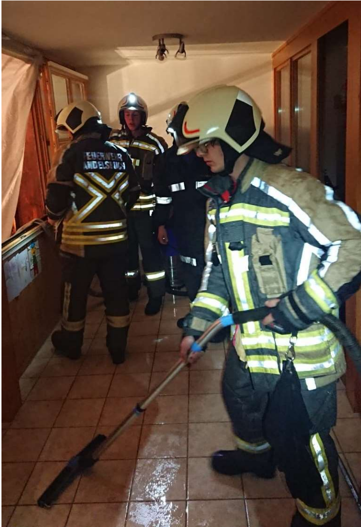
Dachstuhlbrand in Egg Bühel am 14. Juni. Hier wurde mit teils einfachen Mitteln größerer Schaden verhindert.